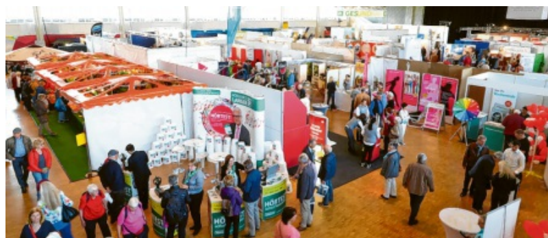
Die Leben, Wohnen, Freizeit dauerte in diesem Jahr nur fünf statt neun Tage. Im kommenden Jahr wird sie wohl ganz ausfallen.

nen Schaden von der Stadt abzuwenden. Die Ulm Messe sei bei der Miete fast auf null gegangen, das Unternehmerehepaar Kinold stelle Mitarbeiter seiner anderen Firma unentgeltlich ab und die Insolvenz-