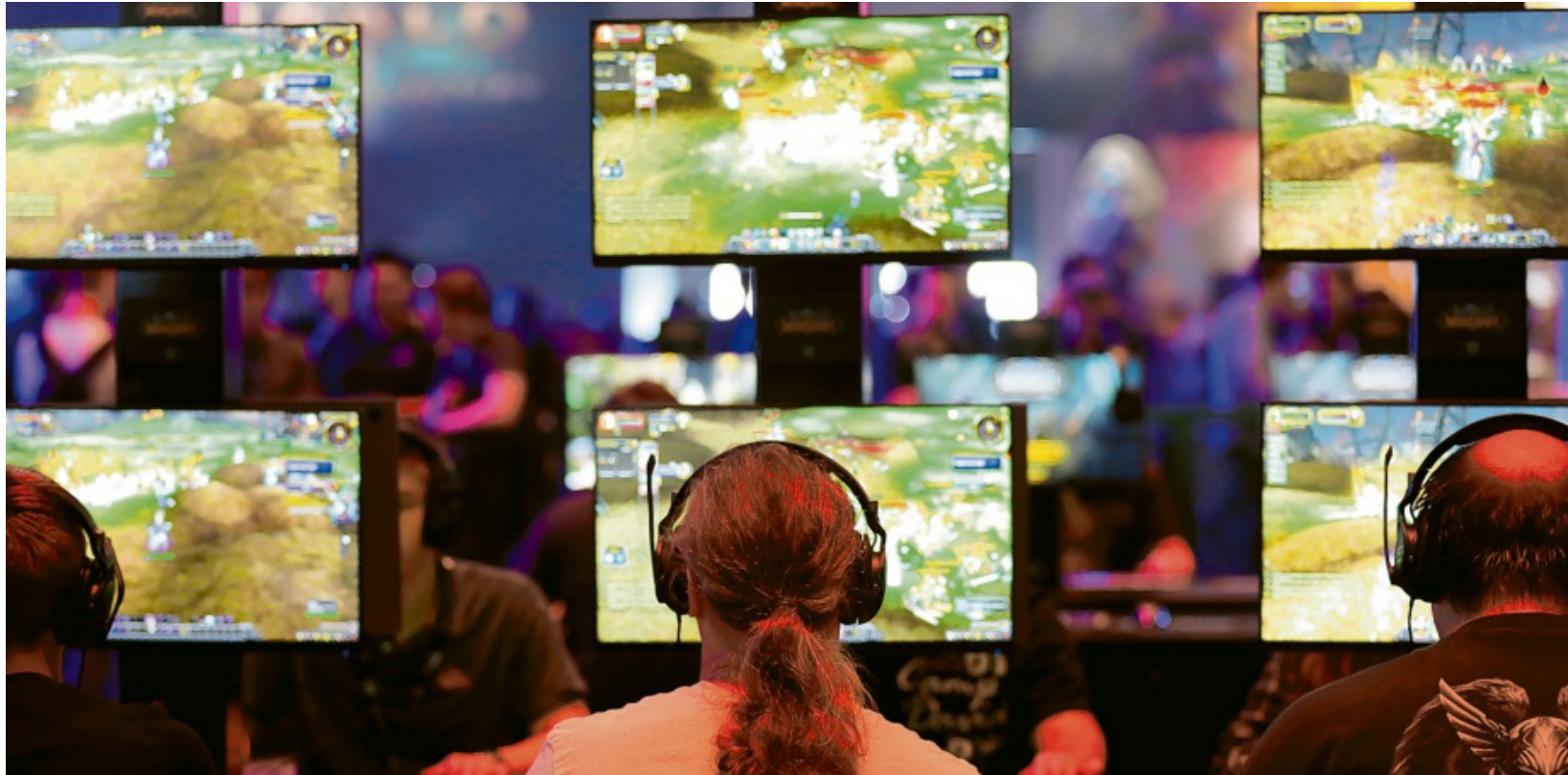
Die virtuelle Spielwelt ist beliebt: 34 Millionen Deutsche zocken nach Angaben des Verbandes der deutschen Games-Branche Computer- und Videospiele. Manche Games haben Suchtpotenzial. Weniger als ein Prozent der Spieler zockt exzessiv.

Online-Spiele wie World of Warcraft, das mit 5,5 Millionen Abonnenten zu den beliebtesten Multiplayer-Online-Rollenspielen weltweit zählt, geraten wegen ihres erhöhten Suchtpotenzials immer wieder in die Kritik. Denn oft haben die Games kein Ende, die Spieler verlieren sich in Raum und Zeit. Über das Zusammenspiel mit anderen entstehen Kontakte in der virtuellen Welt, die weiterläuft, wenn der Spieler offline ist. Die ständige Verfügbar-