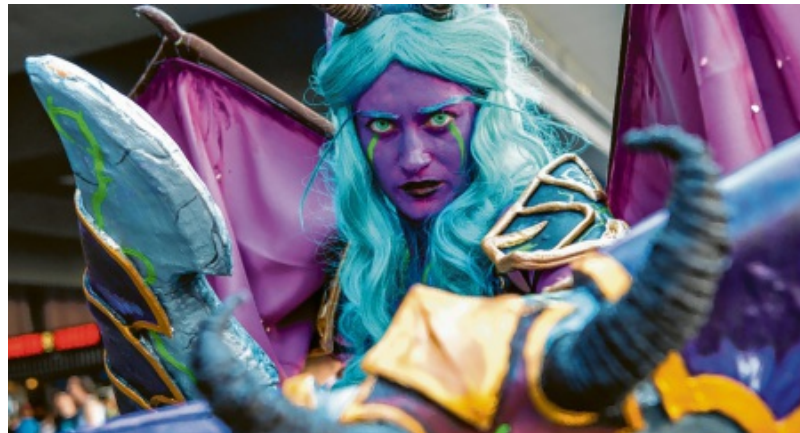
Das Online-Spiel World of Warcraft zählt zu den beliebtesten Games weltweit. Die Figuren werden auch in der realen Welt gerne verkörpert.