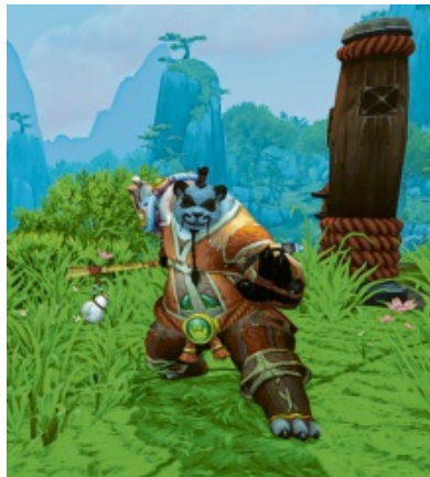
In der virtuellen Welt können Spieler ihre eigenen Charaktere erstellen.